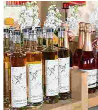
Traubenbrand und Schaumwein