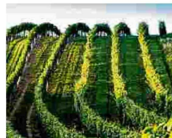
Lebendige Gärten